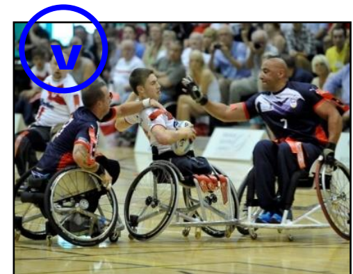
Arrachage non simultané mais second défenseur impliqué (contact fauteuil)