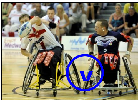
Bouger et lever en l'air la main qui manipule le ballon.