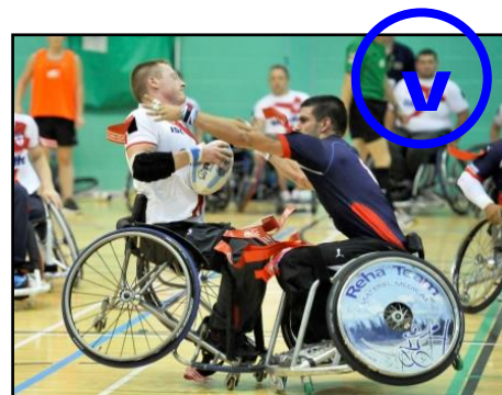
M'opposer sur l'avant en cherchant à déflager