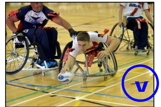
Contorsion du buste pour marquer : ESSAI