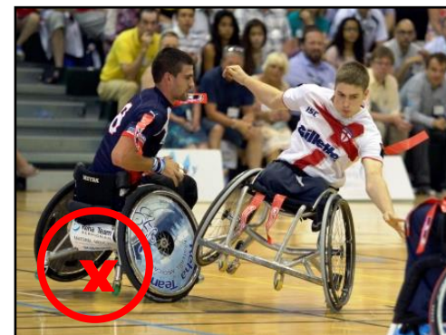
Tous les impacts latéraux doivent être régulés ou sanctionnés