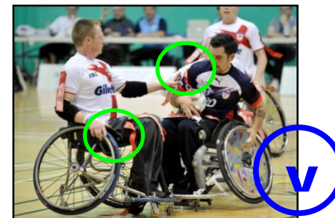
Contrôle parfait du fauteuil et de l'attaquant