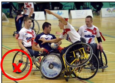
Les 2 mains hors des roues et chute après impact