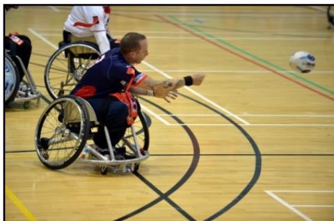
Geste d'un coup de pied – De bas en haut avec le poing