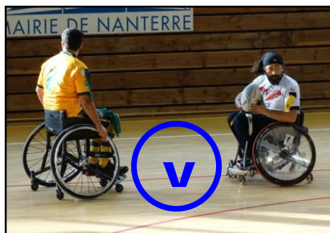
Fauteuil à l'arrêt, face à l'en-but adverse