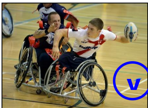
Bouger et lever en l'air la main qui manipule le ballon