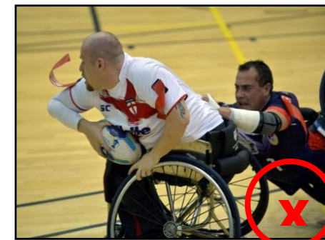
Attraper le corps, le maillot ou le fauteuil d'un adversaire