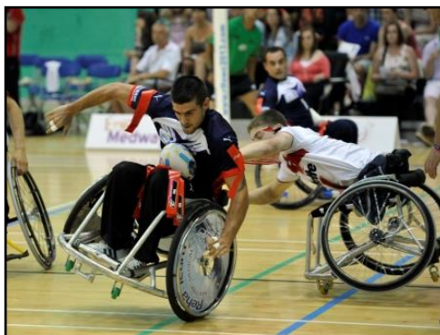
Il est strictement interdit d'attraper le fauteuil d'un adversaire