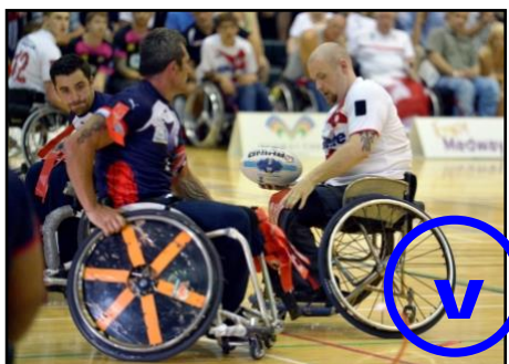
L'attaquant doit garder le contrôle de la balle et remettre ses flags sur des Velcro libres

Si l'attaquant ne fait pas ou ne peut pas faire de passe (absence de partenaire) dans les 3 secondes après avoir touché le sol, l'équipe attaquante sera alors sanctionnable pour anti jeu.