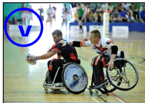
Balle tenue 2 mains en dessous de la ligne des épaules