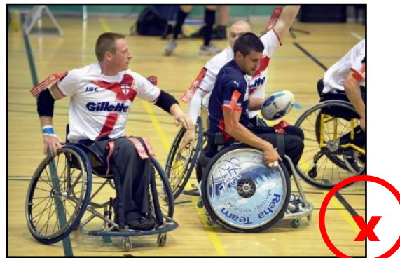
Arrachage non simultané et second défenseur non impliqué (pas de contact fauteuil)