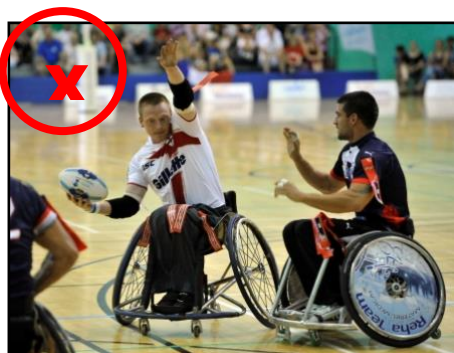
Lever le bras non porteur de balle