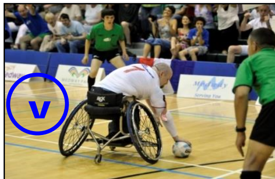
Grandes roues à l'intérieur de l'en-but ; ESSAI