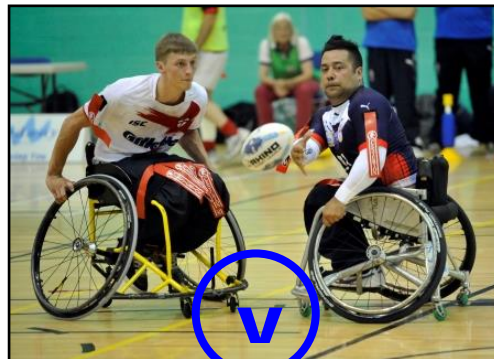
The marker shall wait until it is tapped on the ground