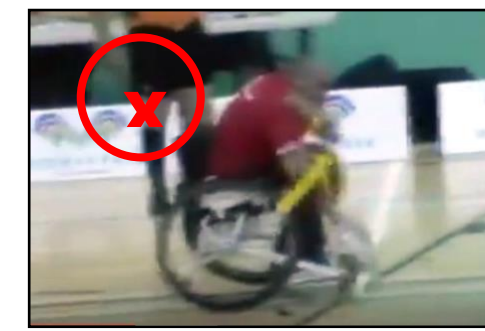
Dans tous les cas de figures, l'attaquant ne peut remettre ses flags et simultanément effectuer son Tenu Dans tous les cas, le flag remis doit être accroché « solidement » au velcro de l'attaquant