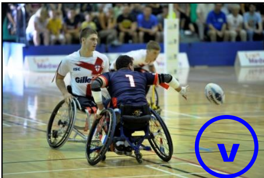
The marker's wheelchair at a standstill with a safety distance and both wheelchairs face to face

En cas d'attente de la passe de l'attaquant, le défenseur peut bouger son fauteuil, mais ne peut pas arracher un flag de l'attaquant réalisant le Tenu une seconde fois.