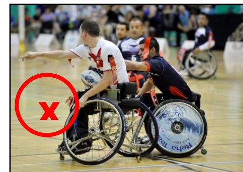
Lever le bras non porteur de balle

Dans cette situation, l'attaquant n'a pas le droit de :