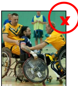
Le défenseur va chuter sur l'attaquant – Pénalité