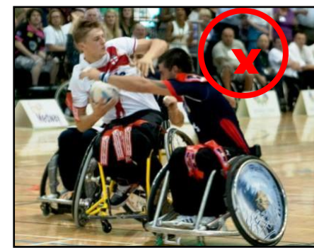
De raffuter ou repousser le défenseur

Dans cette situation d'arrêt du fauteuil. Le porteur de balle n'a pas le droit :