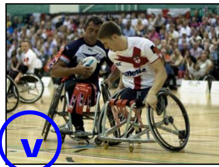
M'opposer passivement au fauteuil adverse