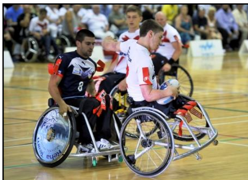
Tous les impacts arrière volontaires doivent être sanctionnés

Il faut que l'impact du défenseur soit en premier une action de blocage sans aucun mouvement du bassin pour accentuer l'impact.