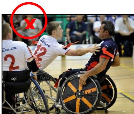
Reculer significativement son buste pour gêner l'arrachage d'un flag