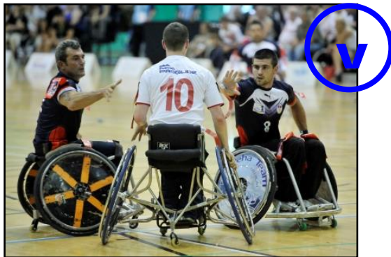
2 défenseurs arrachent 2 flags simultanément

Si le second défenseur n'est pas impliqué dans le placage au moment du premier arrachage (aucun contact entre les fauteuils) et si ce second arrachage n'est pas simultané avec le premier, l'arbitre devra considérer que ce second arrachage est illégal et donner une pénalité pour ralentissement volontaire ou « flopping ».