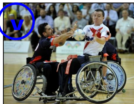
Passer la balle à un partenaire