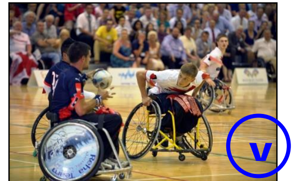
After the upward movement leading to a pass the marker can chase