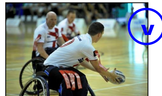
L'attaquant touché le sol puis fait obligatoirement une passe