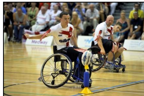
Transformation avec utilisation d'un Tee adapté