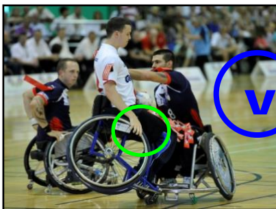
Une main sur la roue – Maitrise fauteuil malgré l'impact

Un joueur peut avoir la gestuelle qu'il désire avec son fauteuil (et notamment avoir les mains libres hors des roues) mais cela ne doit pas générer un danger pour ses adversaires (chute sur eux en attaque comme en défense) ou un arrêt fréquent du jeu du fait de chutes répétées.